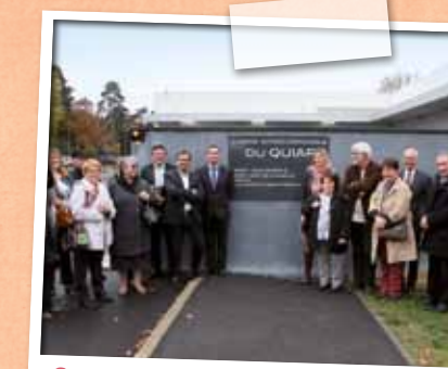
Septembre > La Chapelle Saint Mesmin intègre le Syndicat Intercommunal de Restauration Collective (SIRCO).