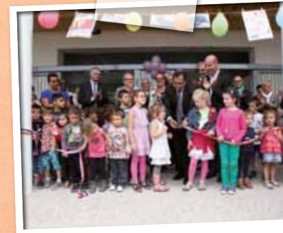
Septembre > L'école maternelle Paul Bert fait peau neuve et de nouveaux accès la desservent.