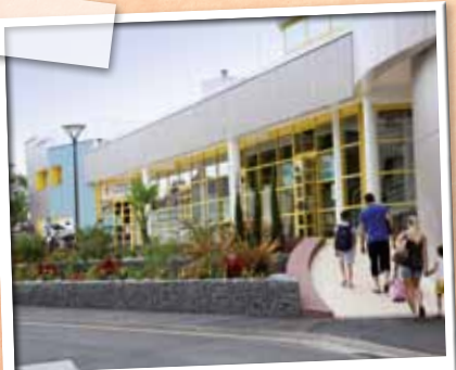
Juillet > Le centre aquatique rénové a connu une belle saison estivale.