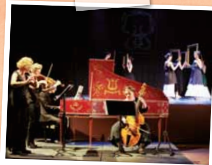
Mars > Festiv'Elles, premier festival intercommunal destiné à faire écho à la journée Internationale des Droits des femmes.