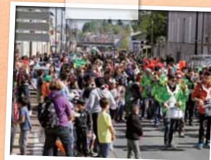
Avril > Le carnaval des « pays du monde » attire plus de 3.500 Stéoruellans dont une majorité d'enfants.