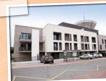
Décembre > La future résidence Locy-Diamants, conçue pour les personnes âgées ou à mobilité réduite, dans le quartier des Chaises.