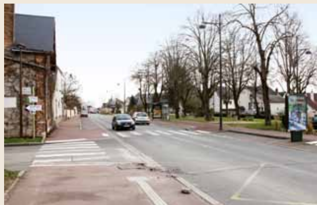
Le programme de rénovation de la voirie prévoit l'aménagement du square Jules Ferry et du mail des Justes de France.

La Ville s'engagera dans l'élaboration d'un Agenda d'accessibilité programmé. Sur 2016 elle mettra en œuvre le plan d'accessibilité des personnes à mobilité réduite (110.000€). Les travaux d'entretien des autres équipements communaux (221.000 €) concerneront : des travaux de réfection de la façade principale de l'hôtel de ville, des travaux de sécurisation des accès de l'hôtel