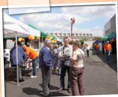
Juin > L'entreprise Bernardi fête ses 60 ans.