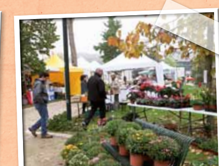
Octobre > Le marché automnal et la bourse aux livres au Parc des Dominicaines.