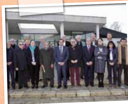
Janvier > Installation du conseil de la laïcité et du vivre ensemble.