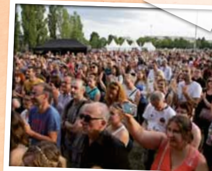
Juin > 12.000 spectateurs aux 25 ans du Grand Unisson.