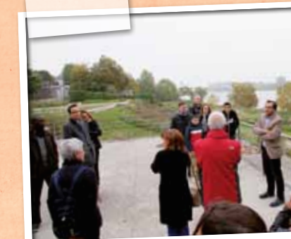
Octobre > L'accueil des nouveaux habitants avec une halte au belvédère de la Chilisse.