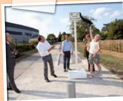
Juillet > Inauguration de l'Allée de la Loire, pour rejoindre le fleuve à pieds, à vélo et en famille.