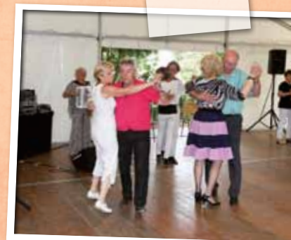
Juillet-Août > Le retour des guinguettes en bords de Loire et au Clos de la Jeunette.