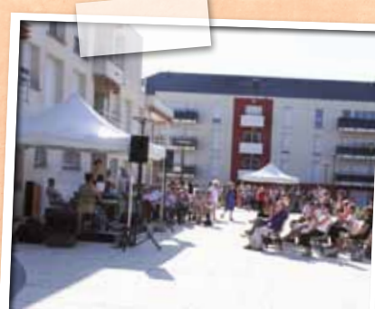
Juillet > Inauguration de la place Edith Piaf et des aménagements du Clos de la Jeunette.