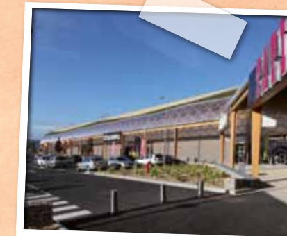
Octobre > Inauguration de l'extension du Parc d'activités commerciales des Trois Fontaines.