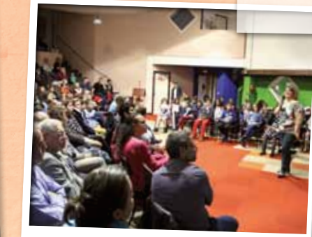
Novembre > Le Conseil Stéoruellan des enfants fête ses 25 ans.