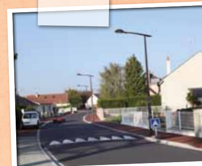
Septembre > Fin des travaux de la rue de la Haute-Jarretière.