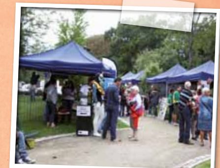
Septembre > Une rentrée des associations sous le signe de la nouveauté.