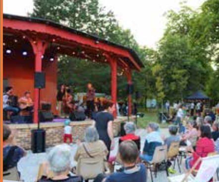
vu à Saint Jean