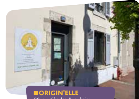
■ ORIGIN'ELLE 80, rue Charles-Beauhaire 🕒 Mardi et mercredi : 10h-18h Jeudi et vendredi : 10h-19h Samedi : 10h-15h