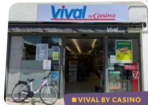
■ VIVAL BY CASINO 2, avenue François-Pavard 🕒 Du lundi au samedi : 7h45-12h45 / 15h15-19h15