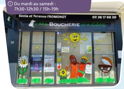
■ KEBAB SAINT JEAN 66, rue Charles-Beauhaire 🕒 Du lundi au samedi : 11h-23h Dimanche : 17h-23h