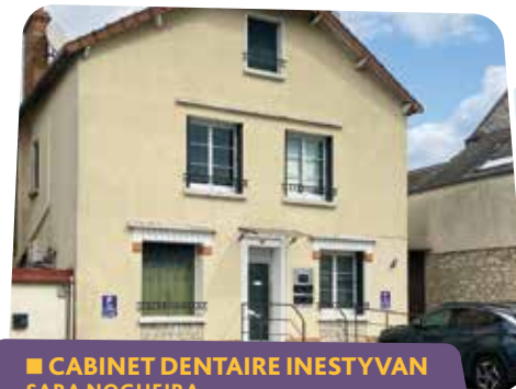
■ CABINET DENTAIRE INESTYVAN SARA NOGUEIRA 90, rue Charles-Beauhaire 🕒 Du lundi au jeudi : 9h30-12h30 / 14h30-18h30 Vendredi : 9h30-12h30 / 14h30-18h

Dans le cadre des travaux de requalification de la rue Charles-Beauhaire qui ont débuté le 18 septembre 2023, l'accès aux commerces et aux services publics communaux reste possible pendant toute la durée des travaux et est précisé par une signalétique spécifique.