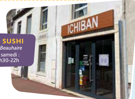
■ ICHIBAN SUSHI 64, rue Charles-Beauhaire 🕒 Du mardi au samedi : 11h-14h / 17h30-22h