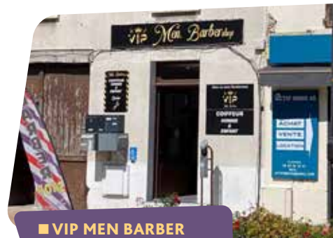
■ VIP MEN BARBER 60, rue Charles-Beauhaire 🕒 Du lundi au samedi : 10h-19h