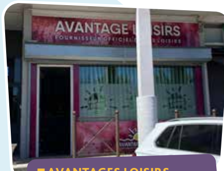
■ AVANTAGES LOISIRS 1, rue Abbé de l'Épée 🕒 Lundi et mardi : 9h30-12h30 / 14h-18h Mercredi et vendredi : 9h30-12h30 Jeudi : 9h30-18h