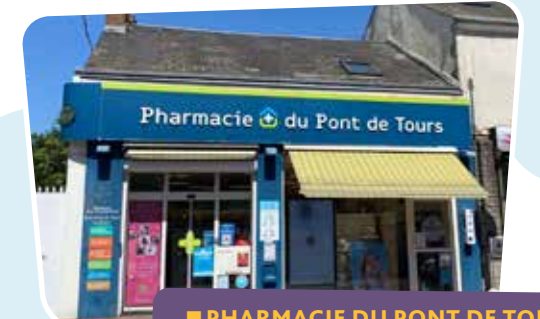
■ PHARMACIE DU PONT DE TOURS 42, rue Charles-Beauhaire 🕒 Du lundi au vendredi : 8h45-12h30 / 14h-19h30 Samedi : 9h15-12h30 / 14h30-19h