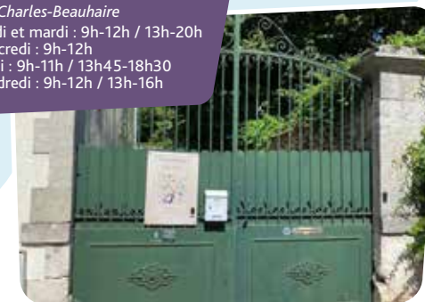
■ SOPHROLOGUE CÉLINE HAGOLLE 72, rue Charles-Beauhaire 🕒 Lundi et mardi : 9h-12h / 13h-20h Mercredi : 9h-12h Jeudi : 9h-11h / 13h45-18h30 Vendredi : 9h-12h / 13h-16h