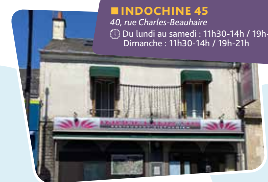
■ INDOCHINE 45 40, rue Charles-Beauhaire 🕒 Du lundi au samedi : 11h30-14h / 19h-22h Dimanche : 11h30-14h / 19h-21h