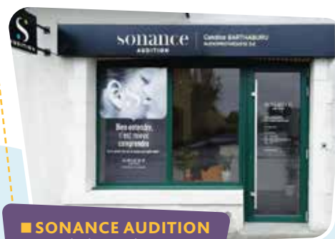
■ SONANCE AUDITION 99, rue Charles-Beauhaire 🕒 Du lundi au vendredi : 9h-12h / 14h-18h