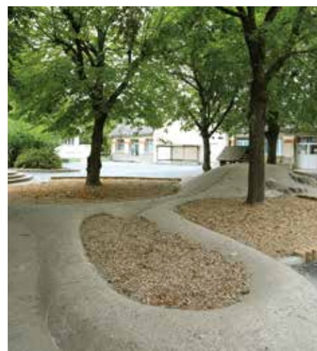
L'espace détente dans la cour de récréation de l'école élémentaire Jules-Lenormand.