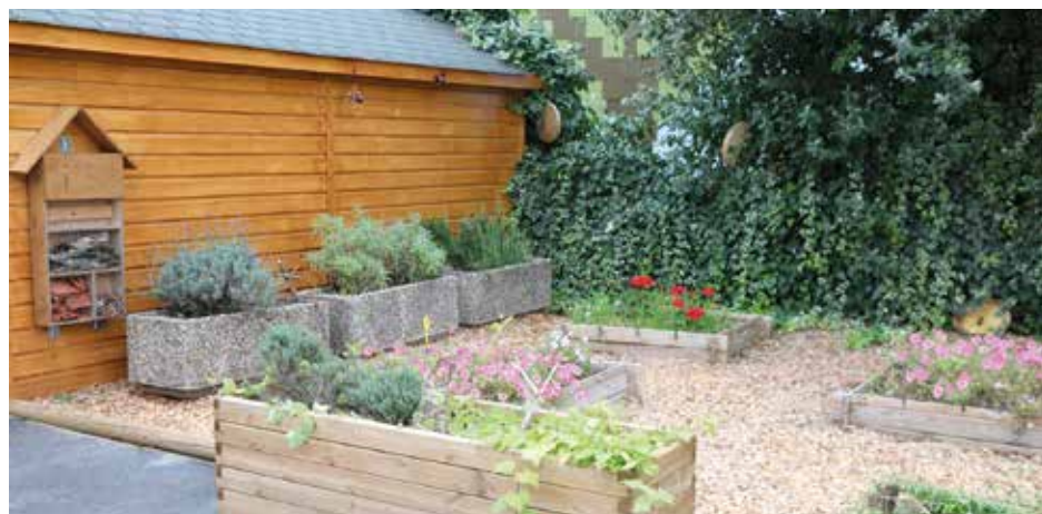
Création d'un espace jardin et détente dans la cour de récréation de l'école maternelle Jules-Lenormand.

Chaque année, et notamment durant la période estivale, de nombreux travaux sont réalisés par la Ville dans les écoles, contribuant à l'amélioration du cadre de vie des enfants.