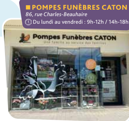
■ POMPES FUNÈBRES CATON 86, rue Charles-Beauhaire 🕒 Du lundi au vendredi : 9h-12h / 14h-18h