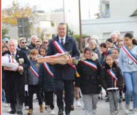
vu à Saint Jean