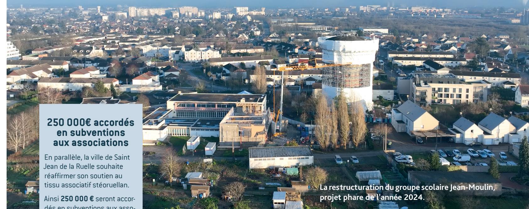
La restructuration du groupe scolaire Jean-Moulin, projet phare de l'année 2024.