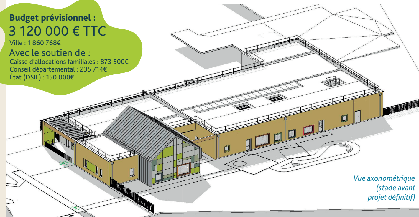
Vue axonométrique (stade avant projet définitif)

Afin d'apporter une réponse qualitative aux besoins des familles en matière d'accueil des jeunes enfants, la municipalité a souhaité construire un équipement petite enfance au centre de la ville, rue René Cassin. Ce nouvel espace, moderne et qualitatif se substituera à l'actuelle structure des Coquelicots.