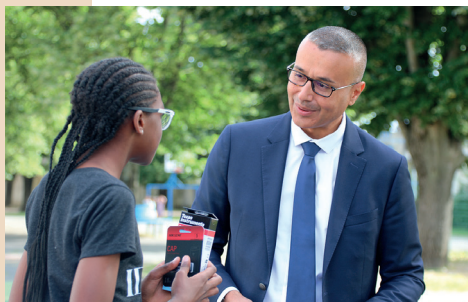
Remise des calculatrices et clés USB par le Maire à tous les élèves de CM2 stéouruellans.

La ville accueille plus de 2000 écolières et écoliers au sein des 6 groupes scolaires publics.