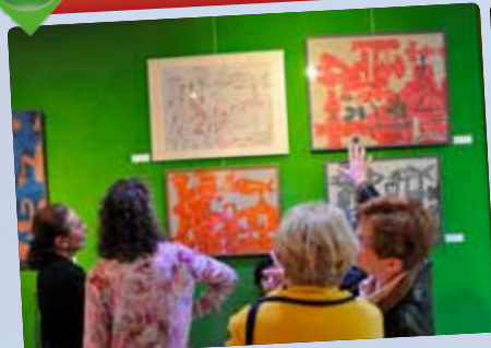
« Le bestiaire de Roger Toulouse » rend hommage au peintre et sculpteur orléanais du 20 e siècle à La Maison de la Musique et de la Danse.