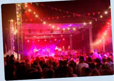
Une fête nationale intercommunale de mille feux sur le pont de l'Europe.