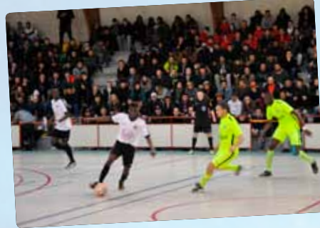
L'équipe de Futsal du FCO Saint-Jean atteint les 16 es de finale de la Coupe de France.