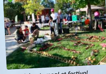
Marché automnal et festival de groupes folkloriques.