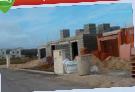
L'écoquartier d'Alleville est en construction. Les premiers habitants ont emménagé dans ce nouveau quartier.