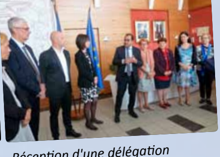
Réception d'une délégation d'Amposta (ville jumelle de Catalogne) à l'occasion du Festival de Loire.