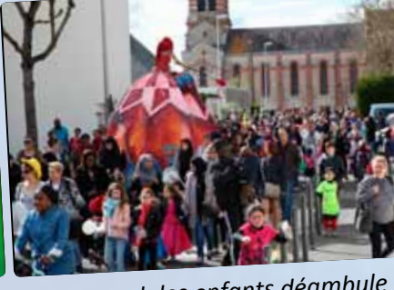
Le carnaval des enfants déambule dans les rues de la ville sur le thème du « bal masqué ». Ohé, ohé !