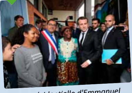
Visite présidentielle d'Emmanuel Macron et du ministre de l'Intérieur Gérard Colomb dans le quartier des Essarts à Saint Jean de la Ruelle.