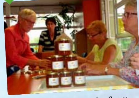
1 re récolte de miel issu des fleurs de prairie du verger pédagogique de Saint Jean de la Ruelle.