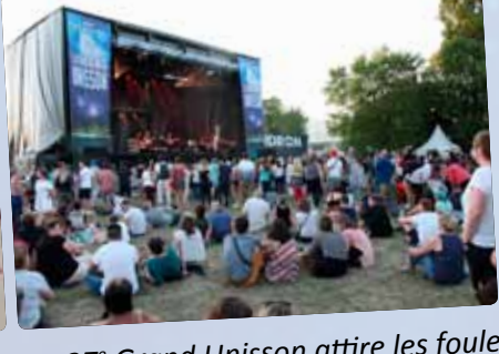
Le 27 e Grand Unisson attire les foules et devient le plus grand festival de musique de la Métropole.