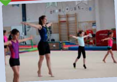
L'Alerte Saint Jean fête ses 110 ans.