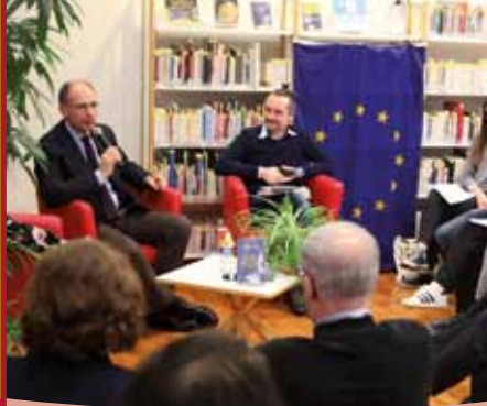
vu à Saint Jean