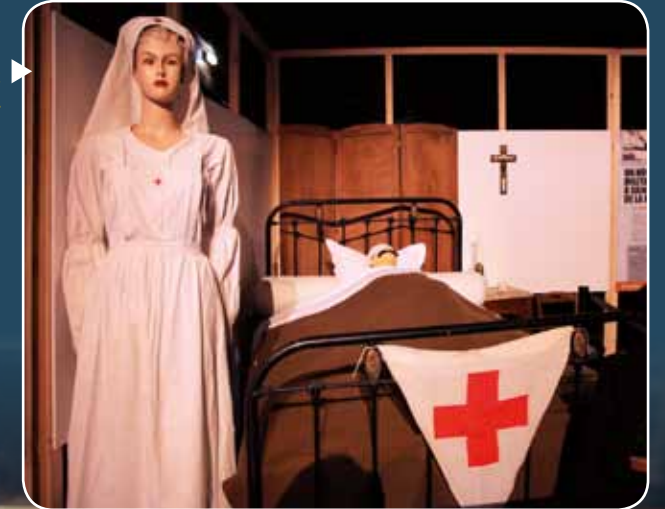
Reconstitution d'une chambre d'hôpital durant la guerre 14-18.