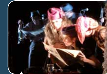
La guerre 14-18 évoquée en chansons par la compagnie Sans Léopard de Paris.

Toujours fidèle au devoir de mémoire, la ville de Saint Jean de la Ruelle commémore, depuis 2014, le centenaire de la Guerre 1914-1918. Cette année, une exposition sur les hôpitaux et blessés de guerre et sur l'entrée en guerre des USA (1917) intitulée « Aider, secourir et soigner », a attiré un millier de visiteurs et plus de 300 scolaires à la salle des fêtes.