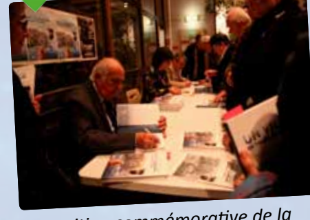
Exposition commémorative de la Grande Guerre et lancement du livre « 1914-1918, Saint Jean de la Ruelle, un village en temps de guerre ».