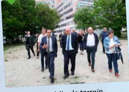
Le préfet en visite de terrain dans le quartier des Chaises.