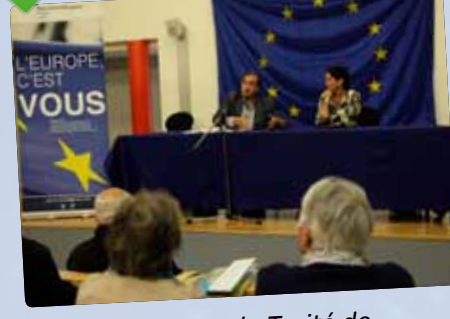
60 e anniversaire du Traité de Rome : Saint Jean de la Ruelle fête l'Europe, notamment à travers un « Euroquiz » en centre-ville.