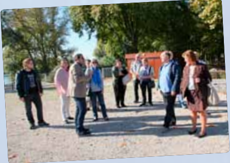
Accueil des nouveaux habitants de la commune.