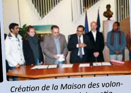
Création de la Maison des volontaires européens et internationaux : la ville accueille trois jeunes étrangers en service civique.