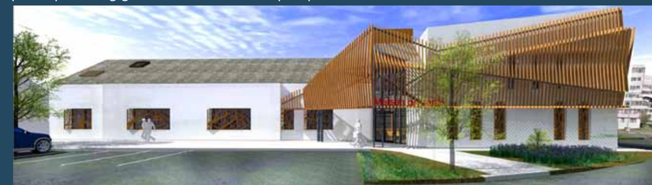
Le projet de maison de santé pluridisciplinaire

Suite à cette intervention, l'Agence Régionale de Santé a bien voulu à l'issue d'une réunion qui s'est tenue le 7 décembre 2018, réintégrer les quartiers prioritaires politique de la ville, comme « zone complémentaire » des territoires carencés en offres de soins. La Municipalité se félicite d'avoir été entendue et de cette décision qui permet à la ville de bénéficier dans le cadre du projet de MSP des Chaises de financements au titre du FCTVA et d'aides à l'installation afin de renforcer l'attractivité de la ville pour l'installation de nouveaux médecins.