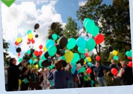
Rentrée des associations sous le signe olympique.