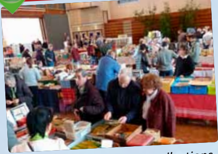
Le Salon national toutes collections de l'Amicale philatélique stéoruellane fête ses 20 ans.