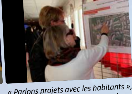
« Parlons projets avec les habitants », échanges sur les grands projets de la ville (site Renault-TRW, rénovation urbaine du quartier des Chaises, centre ville).