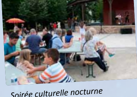
Soirée culturelle nocturne « À Nous la Ville ».