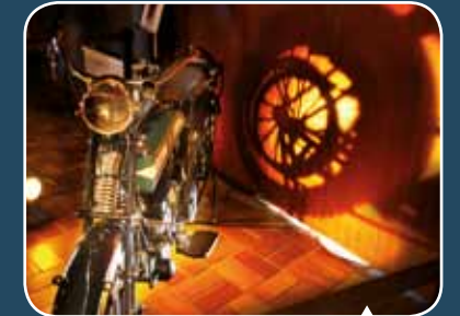
Une moto anglaise utilisée par l'armée française en 1914.