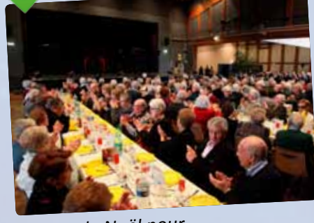
Repas de Noël pour 500 seniors de la commune.